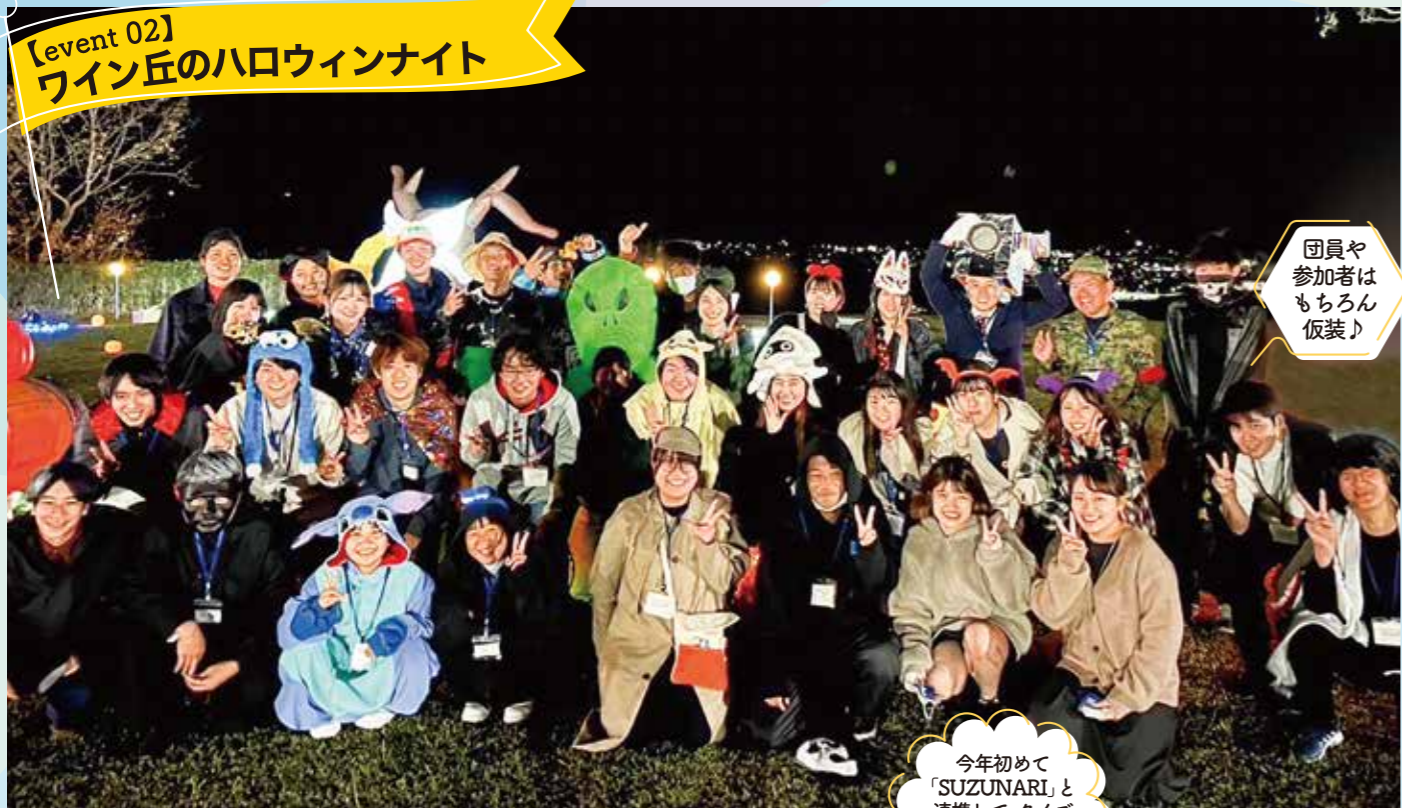
団員や参加者はもちろん衣装♪