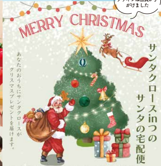
チラシのデザインは団員が手がけました