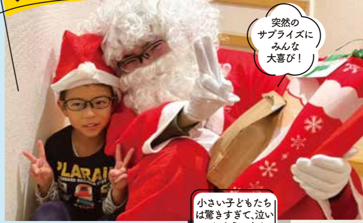
突然のサプライズにみんな大喜び!